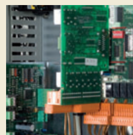
C7000 I/O с опциональной расширительной платой