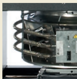
ЕС-вентилятор с опциональным электронагревателем