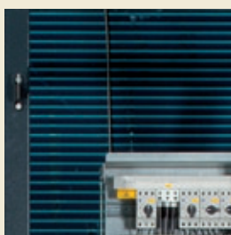
Теплообменник с гидрофильными охлаждающими ребрами